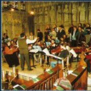
European Union Baroque Orchestra